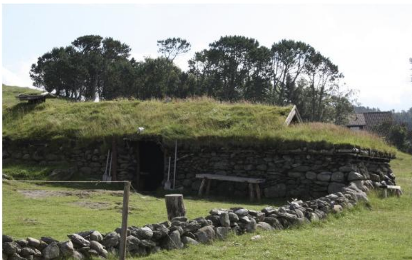
Foto over: Annette Øvrelid, Arkeologisk museum, UiS - Jernaldergården