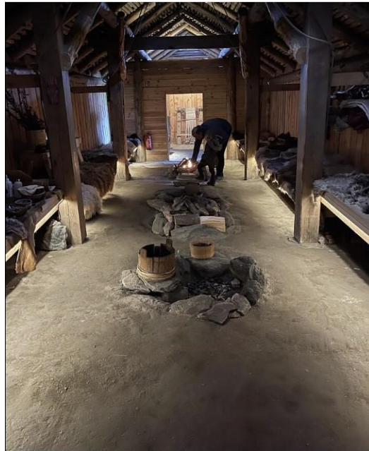
Guiden venter på oss/ Interiør fra Jernaldergården

Vi klatrer inn i vår nære historie på Jernaldergården sammen med en kunnskapsrik guide. På Ullandhaug ligger friluftsmuseet Jernaldergården som vi besøker i mai. Sammen med en guide får vi kjennskap til en spennende tidsperiode og samtidig får vi kunnskap om livet i eldre jernalder. Gården, som ligger på Ullandhaug, er et rekonstruert gårdsanlegg fra folkevandringstiden (350 – 550 e. Kr.). De tre husene er unike, som de eneste av sitt slag i Norge. Husene er innredet tidsriktig og ilden flammer på de opprinnelige ildstedene.